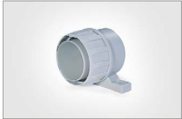
Raccords FG-UH avec fixation.