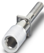
测试插头插片，位数: 1，颜色: 灰色

请注意，本PDF文档中所示数据均生成自在线目录。完整数据请见用户文档。我们的一般下载使用条款已生效。