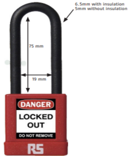
38mm Width 74/76