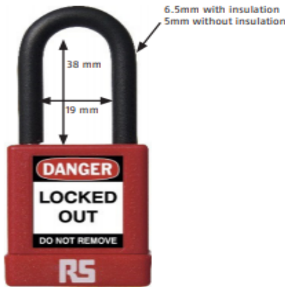
38mm Width 74/40