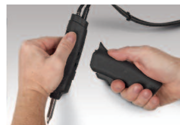
Manche clipsable sur le crayon