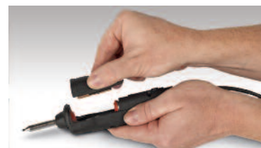
Remplacement rapide de la chambre de collection