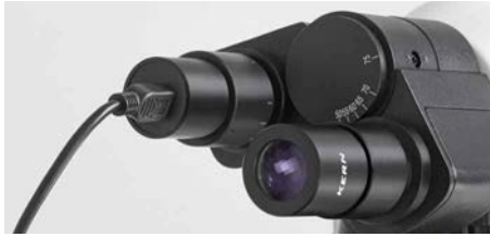
Cámara ocular sujeta al tubo