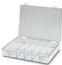
Sortimentkasten, 12 Fächer Außenabmessung 335 x 225 x 55 mm, Material: Polystyrol

Bitte beachten Sie, dass die in diesem PDF-Dokument angezeigten Daten aus unserem Online-Katalog generiert wurden. Bitte finden Sie die vollständigen Daten in der Benutzer-Dokumentation. Es gelten unsere Allgemeinen Nutzungsbedingungen für Downloads.