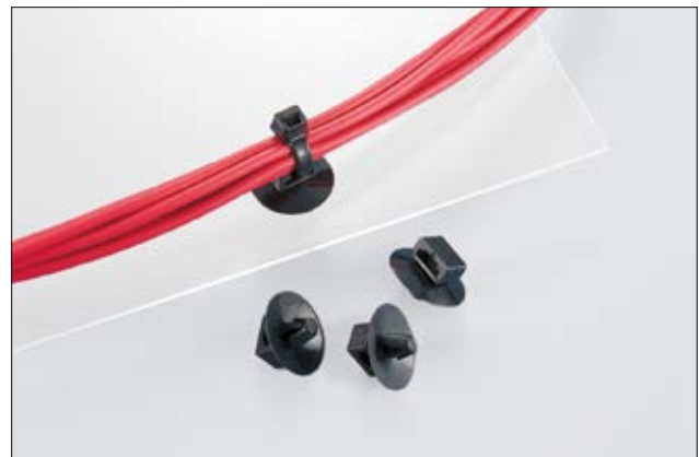
Stabile und einfache Kabelführung mit SFC3.