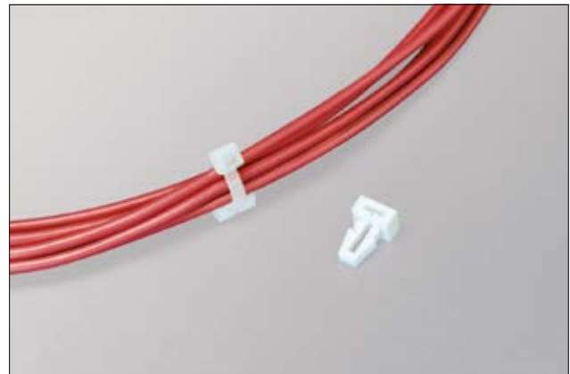
Befestigungselement TM1SF für Lochbohrungen.