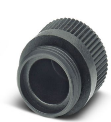
密封帽，7/8"，塑料，用于暗装插拔式连接器，适用于7/8"插座

请注意，本PDF文档中所示数据均生成自在线目录。完整数据请见用户文档。我们的一般下载使用条款已生效。