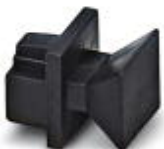
RJ45 孔式连接器的防尘盖