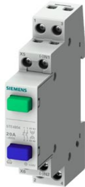
Taster, 1S+1S 20A, 2 Tasten grün blau ohne Rastfunktion