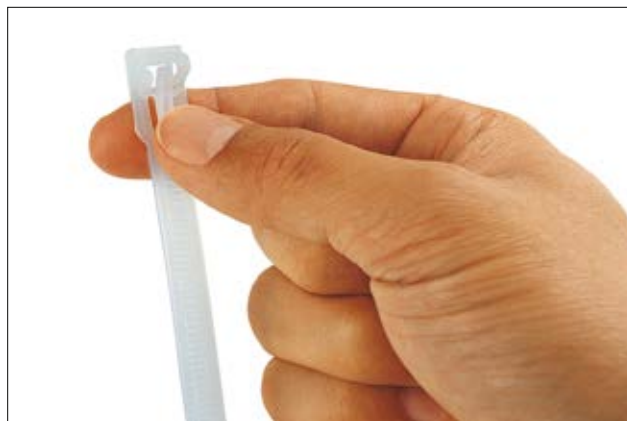
Die Kabelbinder der REL-Serie sind mit einem einfachen Fingerdruck zu öffnen.