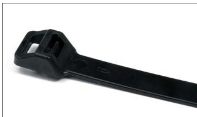
Für große und schwere Bündelungen lassen sich die lösbaren REL250-Kabelbinder verwenden.