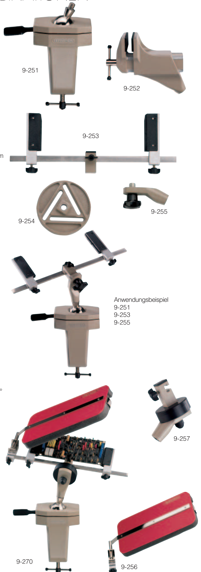
Anwendungsbeispiel 9-251 9-253 9-255