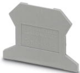
Flasque d'extrémité, Longueur: 42,5 mm, Largeur: 1,5 mm, Hauteur: 30,7 mm, Coloris: gris

Remarque : les données indiquées ici sont tirées du catalogue en ligne. Vous trouverez toutes les informations et données dans la documentation utilisateur. Les conditions générales d'utilisation pour les téléchargements sur Internet sont applicables. ( http://phoenixcontact.fr/download )