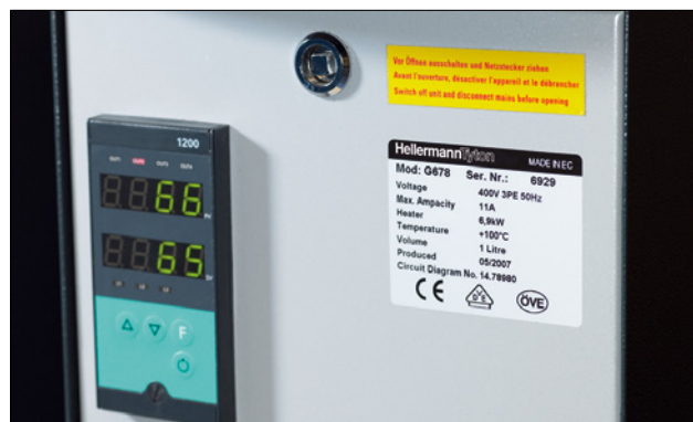
Etichettatura di tipo professionale per una unità riscaldante.