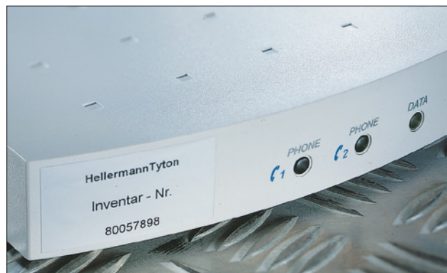
Etichette Helatag per identificazioni durature di componenti.