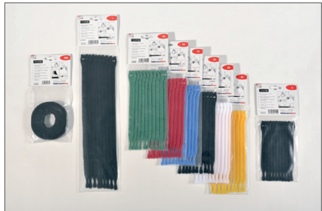
De TEXTIE-serie is verkrijgbaar in diverse afmetingen en kleuren.