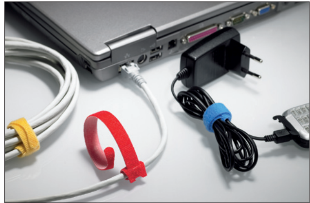
Dankzij de praktische vorm kan de TEXTIE-serie aan de kabel blijven zitten en raakt dus niet kwijt.