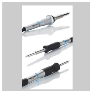
Fers à souder