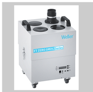
Dispositifs d'aspiration des fumées de soudage