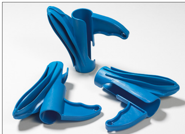
L'utensile applicatore è incluso in ogni confezione Helawrap.