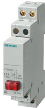
Taster, 1S 20A, 1 Taste rot, LED 230V für lange Zuleitung