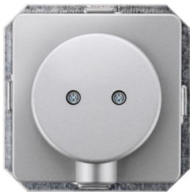
DELTA profil silber Auslassplatte