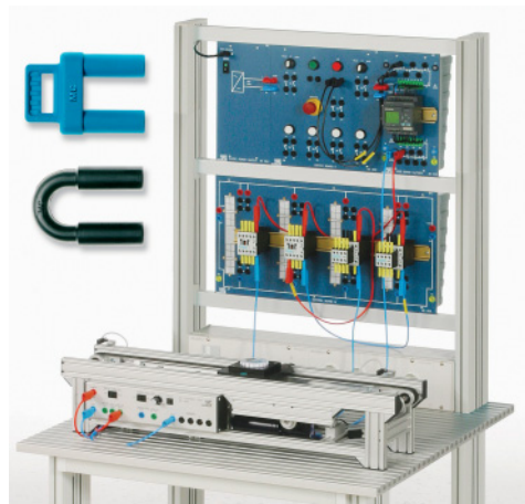
Trainingssystem für Sicherheitstechnik Training system for safety technology Banc de formation