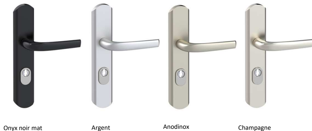
Onyx noir mat