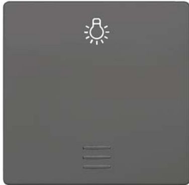
DELTA i-system carbonmetallic Wippe Wippe mit Fenster, Lichtsymbol 55x55mm