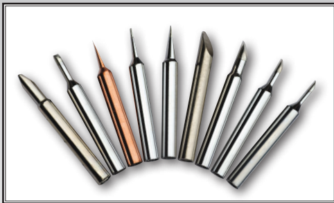
Ersatzspitzen - Serie 1100