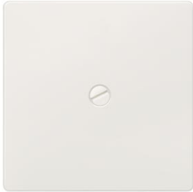
DELTA i-system titanweiß Wippe schraubbar 55x55mm