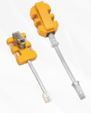
Adaptadores modulares de 4 y 8 posiciones