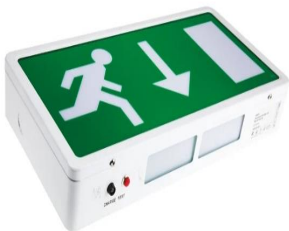
795-9732 | LED emergency exit box 3Hr