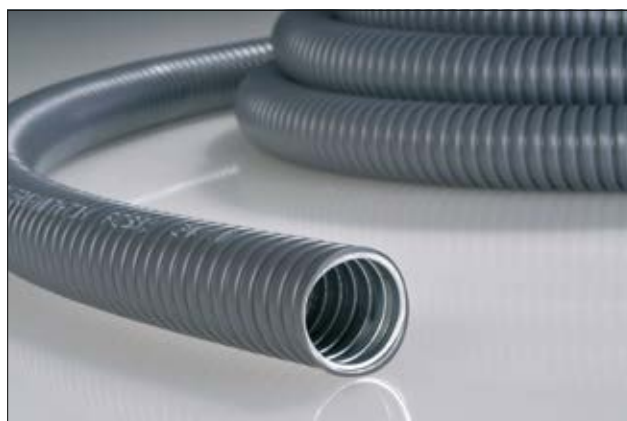
HelaGuard PCS en version grise.

Des conduits métalliques flexibles avec un revêtement en polyuréthane sont également disponibles.