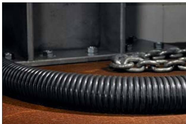
Gaine en acier galvanisé avec revêtement PVC HelaGuard PCS.

Des conduits métalliques flexibles avec un revêtement en polyuréthane sont également disponibles.