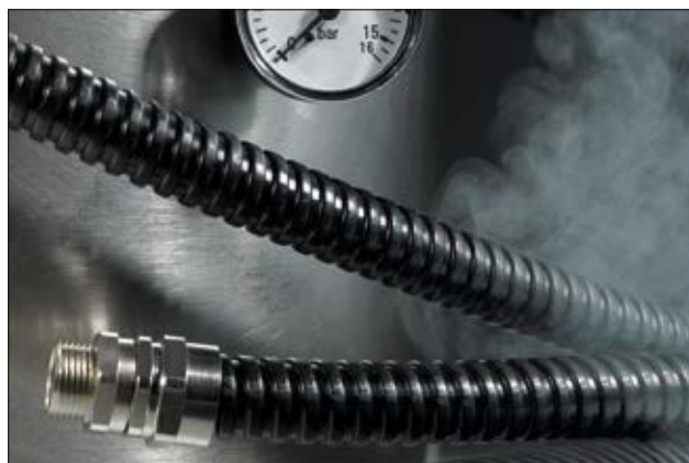
Gaine HelaGuard NCS pour une resistance aux acides et aux solvants accrues.