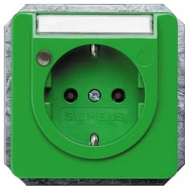
DELTA profil grün (SV) SCHUKO Betriebsanzeige, Schriftfeld 10/16A 250V 65x65mm