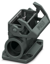
面板式安装底座外壳 D15，带单锁扣，标识材料: PA 6.6-FR，电缆出线: 2，水平，2x M25，高度: 52 mm，电缆密封: 无，标准

请注意，本PDF文档中所示数据均生成自在线目录。完整数据请见用户文档。我们的一般下载使用条款已生效。