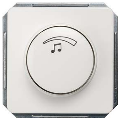
DELTA Lautstärkeregler titanweiß 3W 27 Ohm, mono