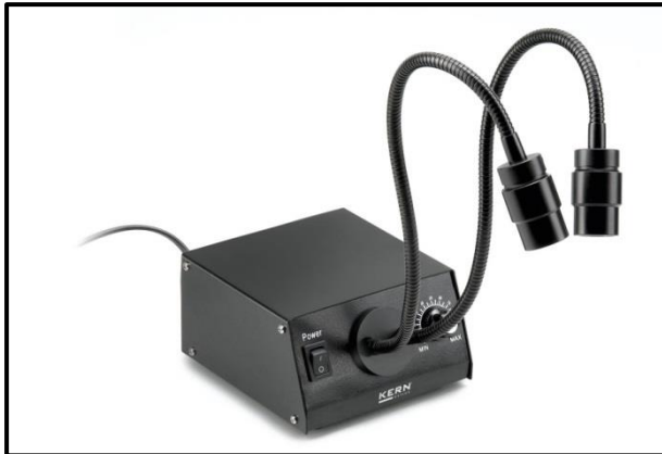
Éclairage col-de-cygne typique

Les unités d'éclairage adaptées aux appareils de la série OSE-4 sont des éclairages cols-de-cygne (voir la figure). Ils peuvent être à LED ou à halogène et disposent d'un interrupteur et de différents réglages.