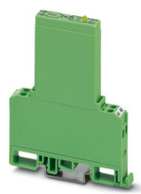
Leistungs-Solid-State-Relais, mit Leuchtanzeige und Schutzbeschaltung im Ein- und Ausgangskreis, Eingang: 5 V DC, Ausgang: 5-36 V DC/ max. 1 A

Bitte beachten Sie, dass die in diesem PDF-Dokument angezeigten Daten aus unserem Online-Katalog generiert wurden. Bitte finden Sie die vollständigen Daten in der Benutzer-Dokumentation. Es gelten unsere Allgemeinen Nutzungsbedingungen für Downloads.