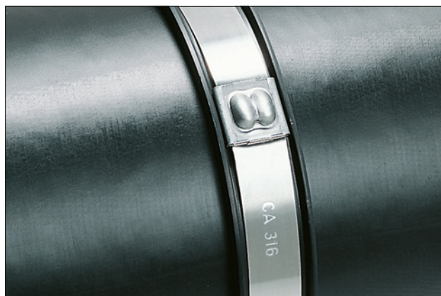
Collier de la série MBT avec profilé de protection LFPC.