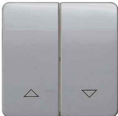
DELTA profil silber Wippe 2-fach Symbol Auf/Ab 65x65mm