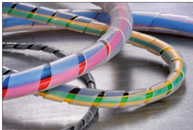
Frette spiralée SBPTFE, idéale pour les conditions extrêmes.