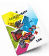
Les outils Indispensables SAM 2021