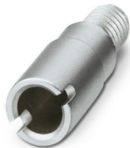
测试插头插片，位数: 1，颜色: 银色

请注意，本PDF文档中所示数据均生成自在线目录。完整数据请见用户文档。我们的一般下载使用条款已生效。