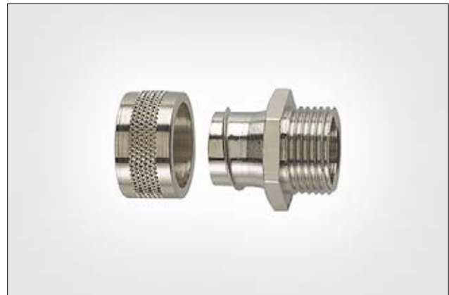
Raccord avec filetage externe fixe, HelaGuard PCS-FM.