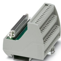
VARIOFACE-Modul mit Schraubanschluss und D-SUB-37-Steckverbinder, zur Montage auf NS-35-Tragschienen

Bitte beachten Sie, dass die in diesem PDF-Dokument angezeigten Daten aus unserem Online-Katalog generiert wurden. Bitte finden Sie die vollständigen Daten in der Benutzer-Dokumentation. Es gelten unsere Allgemeinen Nutzungsbedingungen für Downloads.