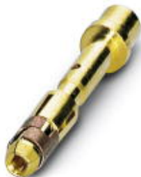
Crimpkontakt, gedreht, Einzelkontakt, Kontaktdurchmesser: 1 mm, Crimpbereich: 0,34 mm 2 ... 0,5 mm 2

Bitte beachten Sie, dass die hier angegebenen Daten dem Online-Katalog entnommen sind. Die vollständigen Informationen und Daten entnehmen Sie bitte der Anwenderdokumentation. Es gelten die Allgemeinen Nutzungsbedingungen für Internet-Downloads. ( http://phoenixcontact.de/download )