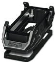
HEAVYCON EVOパネル取付けベース、プラスチック製、B24、ダブルロッキングラッチ用、高さ30.5 mm、平型ガスケット

このPDF文書に表示されているデータはフェニックス・コンタクトのオンラインカタログから作成したものです。全データはユーザーマニュアルに記載されています。ダウンロードの規定は有効です ( http://phoenixcontact.jp/download )