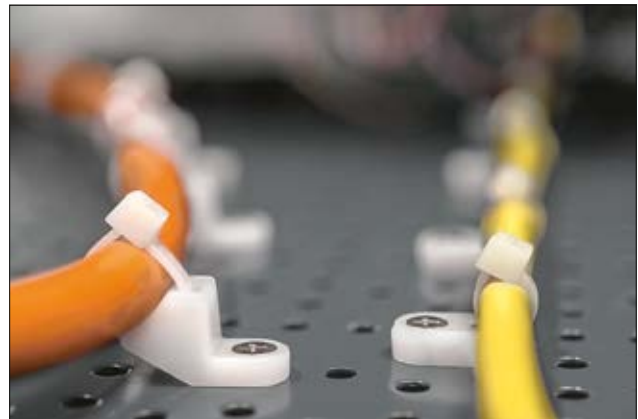
LKM, CL8 (l) und FH (r) Befestigungssockel für Anwendungen mit geringem Platzbedarf.