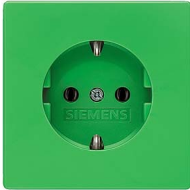
DELTA style grün (SV) SCHUKO ohne Krallen 68x68mm 10/16A 250V