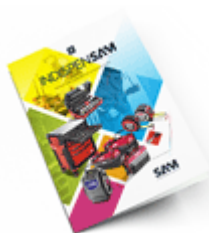
Les outils Indispensables SAM 2021

Découvrez tous nos produits dans nos catalogues en ligne