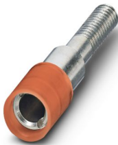
测试插头插片，位数: 1，颜色: 红色

请注意，本PDF文档中所示数据均生成自在线目录。完整数据请见用户文档。我们的一般下载使用条款已生效。