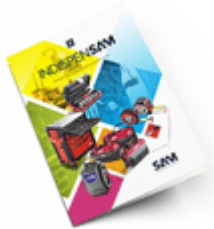
Les outils Indispensables 2021

Découvrez tous nos produits dans nos catalogues en ligne