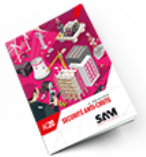
Sécurité anti-chute 2020