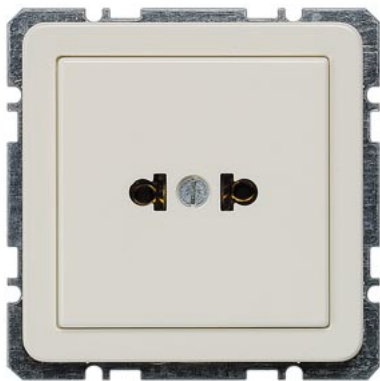
DELTA profil titanweiß SCHUKO 15A 125V amerikanischer Standard C73 51x 51mm