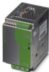
24V DC/10A DIN导轨安装式电源，初级开关模式，3相。

Please be informed that the data shown in this PDF Document is generated from our Online Catalog. Please find the complete data in the user's documentation. Our General Terms of Use for Downloads are valid ( http://download.phoenixcontact.com )