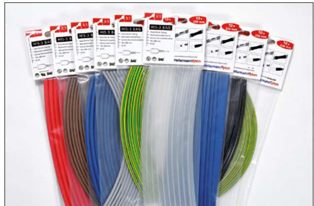
HIS-3 BAG finnes i syv forskjellige farger og fire størrelser.