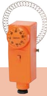
RAR 875 01