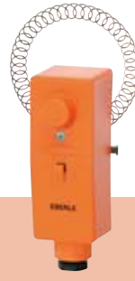
RAR 875 02